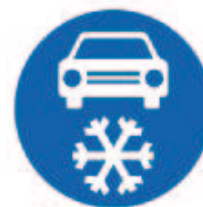
Zimní výbava (č. C 15a)

Podle průzkumů a také na základě zkušeností bylo zjištěno, že zimní pneumatika s hloubkou dezénu nižší než 4 mm (u vozidel do 3 500 kg) již ztrácí své vlastnosti na sněhové pokrývce, ztrácí tzv. samočisticí efekt.