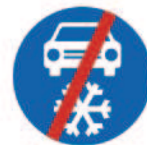
Zimní výbava - konec (č. C 15b)