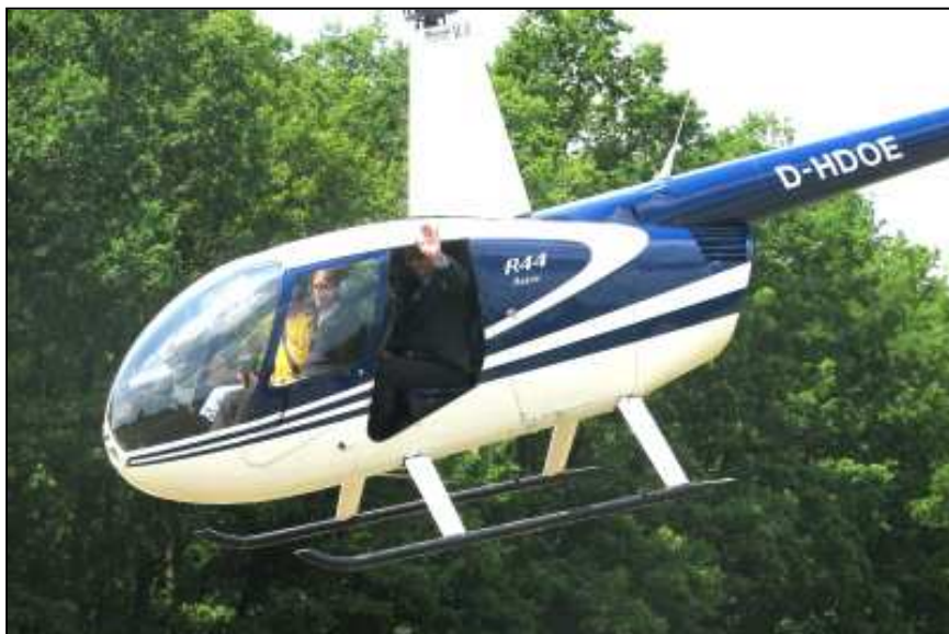
Vrtulníkem se proletěl i italský starosta z partnerského města Fano.