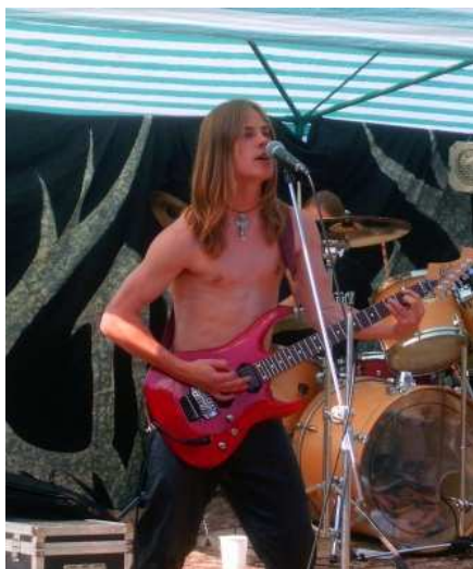
Divočák fest patřil zejména mladým