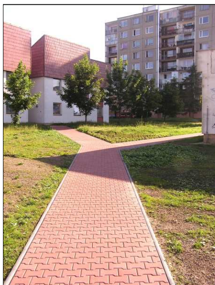
Chodník propojující DPS je konečně skutečností.