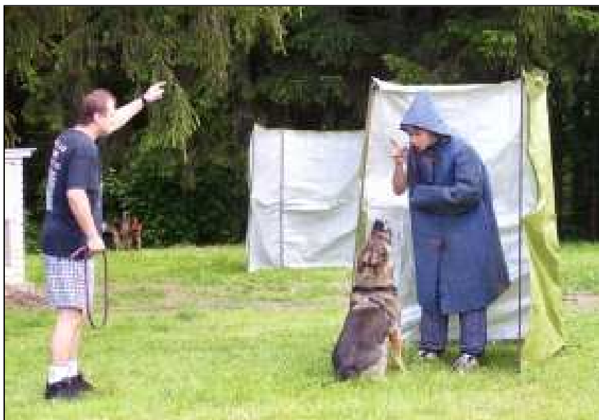
Velmi pěkné ukázky předvedli členové stříbrského kynologického klubu.